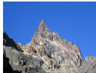
Les Cornes du Diable

Journée d'escalade sur une voie en 5 longueurs (voie de 5+, 6a) - retour au camp de base