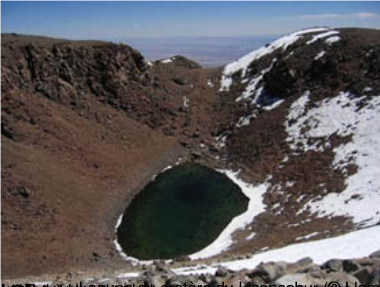
Un petit lac au bord du cratère du Licancabur (petit défilé, zone d'engagement, zone morte, zone d'altitude)