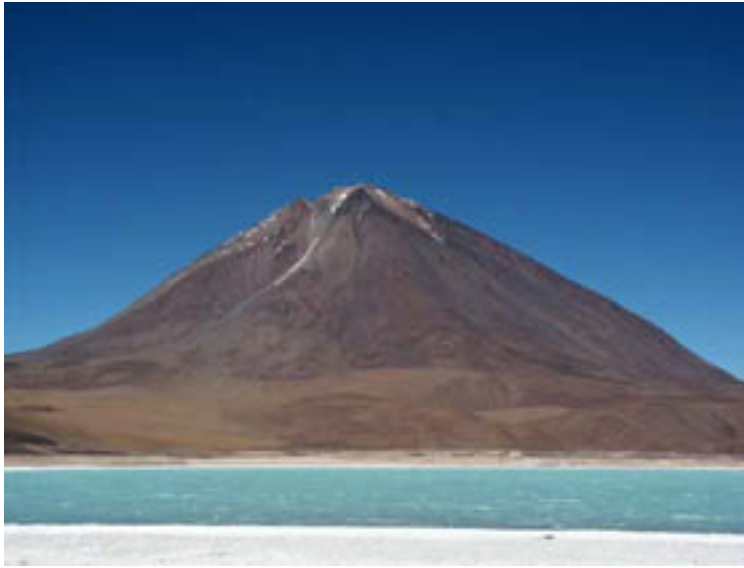
Licancabur dominant la Laguna Verde

Le Licancabur (5918 m) qui en langue Kunsu signifie "la montagne du peuple" est le volcan de la Cordillère Lipez surplombant la célèbre Laguna Verde. La montée au sommet sur un pierrier est relativement laborieuse mais la vue panoramique sur le désert du Sud Lipez vaut le déplacement.